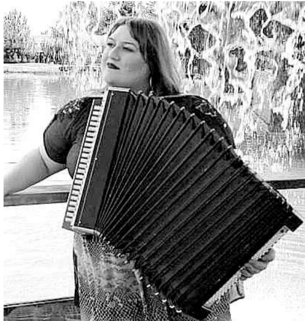
Ныхас ныффыста Бызыккаты Земфирæ

— Оланæ, дæ фæндтæ дæ кбхуы бафтæнт. Уал-дзæджджы хорзæх дæ уæд æмæ амонджджы у!