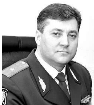
Уый тыххæй фехъусын кодта министрæдæй пресс-службæ.

Зындгонд кувд у, афтæмæй Цæгат Ирыстоны мидхъуыддæгты министр Михаил СКОКОВЕН растæгæй-растæгæй фембæлдтытæ ваййы районы цæрджытимæ. Министрадæй разамондæн радон ахæм фембæлд 25 апрелы уыдзæн Æрæфы районы.