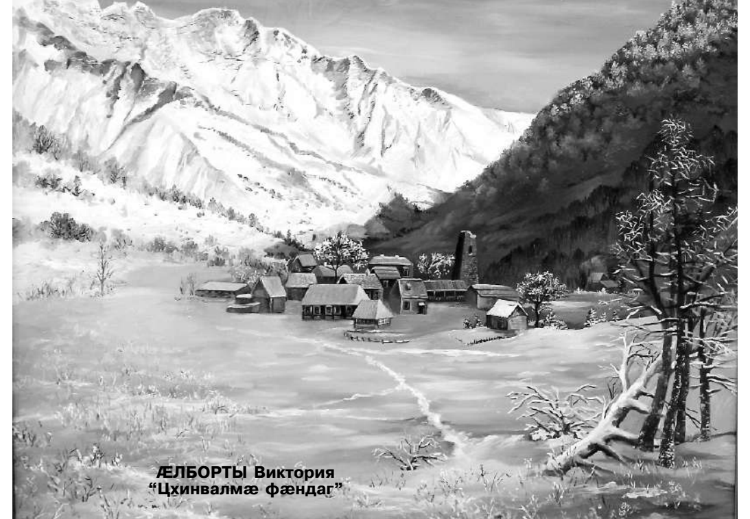
ДЕЛБОРТЫ Виктория "Цхинвалмә фәндаг"

Цәвиттон, ацы цау ивгьуыд азы декабры әрцәд. Кравченкоты фатерыл зыңг сирвәзт райсоммә әввахс. Бынатмә фыццагдәр 16-әм зыңхуысыңгәнән-ирвәзыңгәнән хайы куджытә әрбахәццә сты. "Ахәм заман адәймагә афтә фәкәсы, цыма рәстәг дьууә кәнә әртә хатты тагддәр фәцәуы. Дә