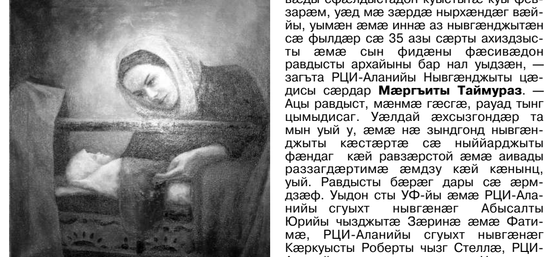
БЛЕЦОЙТЫ Каринә "Авдәны зарәг"

дәр әвдыст цыдысты әппәтуәрәсөон әмә регионалон равдыстыты. Дызәрддәггә нәу, Сәбанты Иргә, Туаты Лирә, Кьонати Хъазыбег, Плиты Зәлиңә әмә равдысты иннә архайджыты куыстытә дәр адәмы зәрдәмә фәндаг кәй сәрдзысты, уый. Аивады әвзәгәй бәрәзонд систой райгуыраән бәстәйы әрдзы рәсугьдзидинад, нә адәмы истори, царды табуягтә.